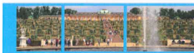
VFF Jahreskongress Potsdam